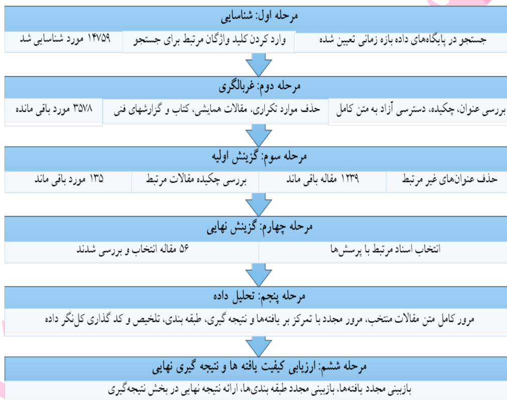
شکل ۱- مراحل اجرای تحقیق و نحوه انتخاب منابع

این مطالعه تنها پژوهش‌های انجام شده به زبان‌های فارسی و انگلیسی را مورد توجه قرار داده و تنها اسنادی که در سال‌های ۲۰۰۰ تا ۲۰۲۴ میلادی و ۱۳۸۰ تا ۱۴۰۳ شمسی منتشر شده بودند بررسی شدند. مقالات کنفرانسی، گزارش‌های پژوهشی، موارد تکراری و فصل‌های کتاب‌ها که موضوعات آن‌ها متنوع، دسترسی به آن‌ها محدود بود از روند بررسی کنار گذاشته شدند، سپس مجموع مقالات به دست آمده از مرورگرهای علمی ۳۵۷۸ شد. در گام بعد آن دسته از مقالات که عنوان‌شان با موضوع مورد مطالعه غیرمرتبط بود از چرخه بررسی کنار گذاشته شدند و تعداد مقالات در این مرحله به ۱۲۳۹ تقلیل یافت. در مرحله بعد چکیده مقالات موجود در چرخه بررسی مورد مطالعه دقیق قرارگرفت و موارد غیرمرتبط با پرسش‌های اصلی تحقیق کنار گذاشته شدند. در گام آخر متن کامل ۱۳۵ مقاله مورد مطالعه و بررسی قرار گرفت و تعداد ۵۶ مقاله منتشر شده برای بررسی در این مطالعه انتخاب شدند.