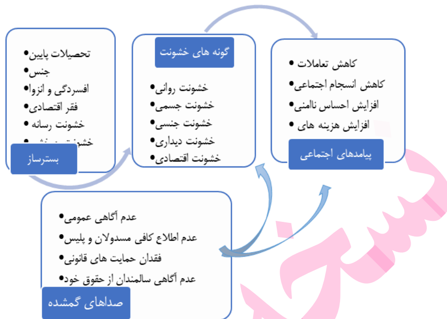
شکل ۱- مقولات مستخرج از یافته‌ها و ارتباط بین آنها